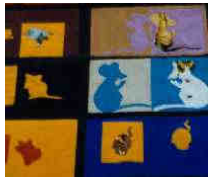
souris "en miroir"