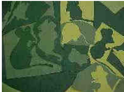
des souris, des verts