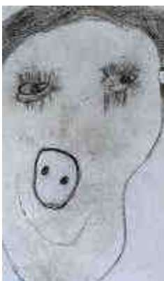
autoportrait au fusain (détail)

Avant de passer à l'autoportrait les enfants se sont beaucoup regardés, ont fait de nombreuses observations. Le travail au fusain apporte matière et contrastes.