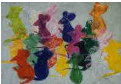
une seule souris, plein de couleurs

décalquer des souris dans des livres pour enfants en moyenne et grande sections