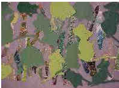
des souris vertes dans l'herbe