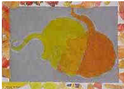
1 souris, 2 souris, 3 couleurs