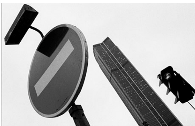
C'est une .....