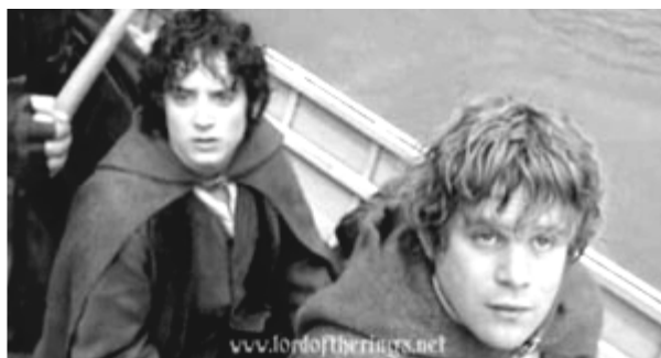
C'est une .....