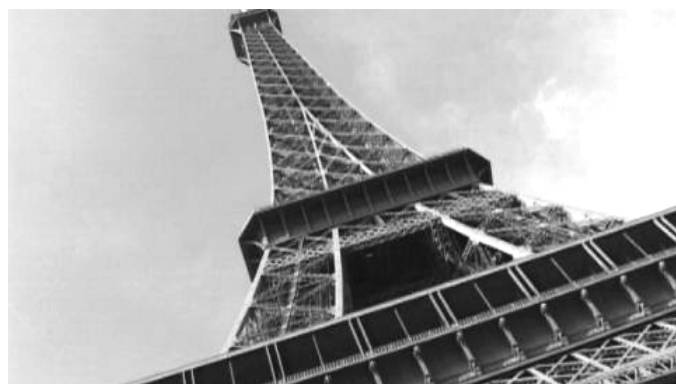
C'est une plongée - une contre plongée