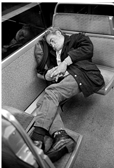
C'est une plongée - une contre plongée