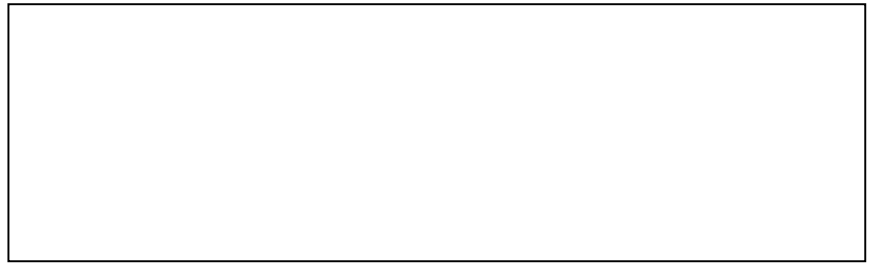
Schéma de l'expérience :