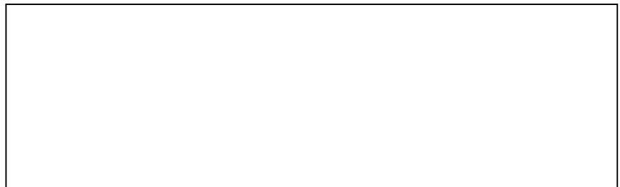
Schéma de l'expérience :

B1 - Dans un verre, mets de l'eau puis ajoute du papier. C'est tout !