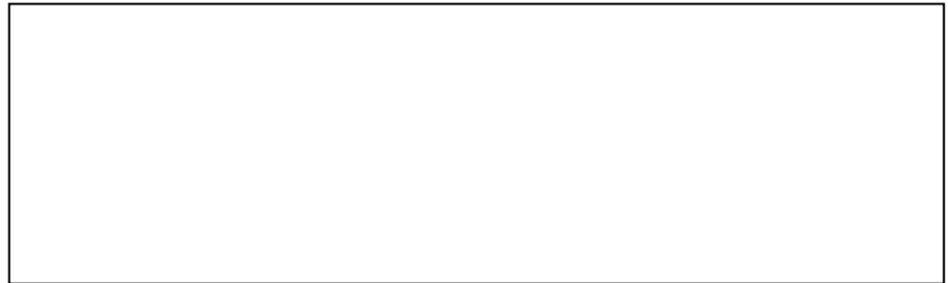
Schéma de l'expérience :

C- Te paraît-il nécessaire de laisser des verres en attente pour en observer plus tard le résultat ?