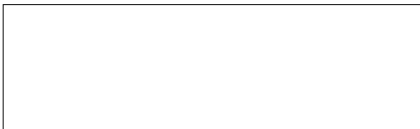
Schéma de l'expérience :

A2 - Dans un autre verre, mets de l'eau puis ajoute un peu de chocolat. Remue avec une cuillère.